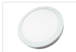
Luna Pro S met ingebouwde sensor en noodunit